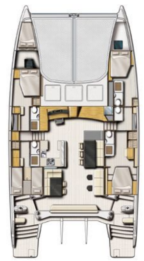
Version 4 Cabines + skipper 4 Cabin Version + skipper