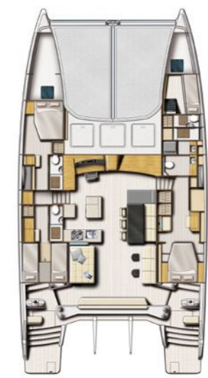
Version propriétaire 3 Cabines + skipper Owner version 3 Cabin + skipper

CATANA sources from only the best equipment suppliers and manufacturers for the interior finish, enabling us to offer you the very best of our products combined with CATANA know-how. A team of professionals is at your disposal to help you design your own interior layout so that you will feel right at home on board your unique boat. Performance, safety, longevity, innovation, standard of finish, attention to detail, such are the main characteristics and values of a CATANA.